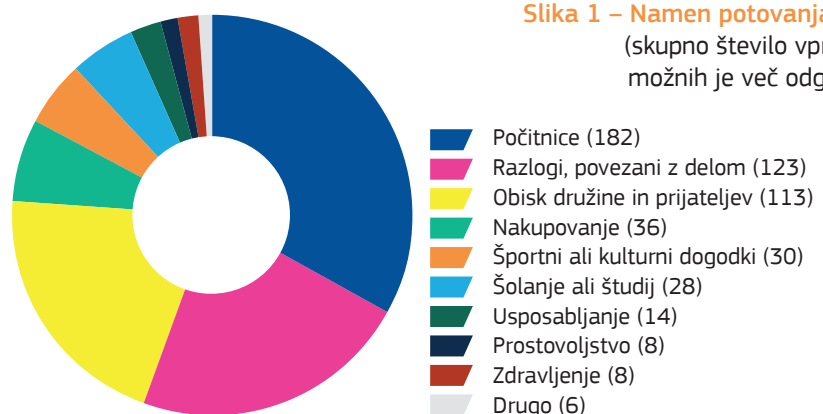
Slika 1 – Namen potovanja po EU (skupno število vprašanih; možnih je več odgovorov)

43 vprašanih je povedalo, da so pri uveljavljanju pravice do prostega gibanja doživeli neko obliko diskriminacije.