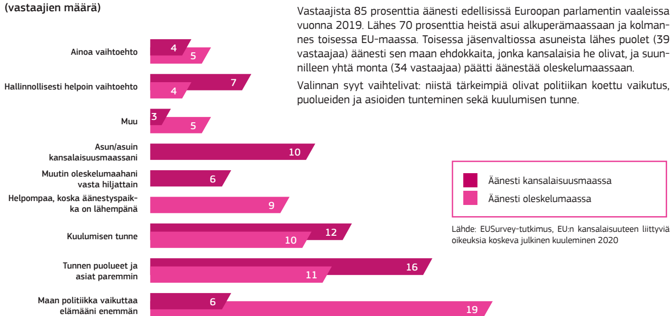
Kuva 3 – Syyt äänestämiseen oleskelumaassa tai kansalaisuusmaassa (vastaajien määrä)

Sähköistä äänestämistä pidettiin ulkomailla asuvien kansalaisten kannalta käteväenä ja helpompana. Vastaajien suurimpia huolenaiheita olivat yhtäältä petoksen tai äänten peukaloinnin (173 vastaajaa) ja toisaalta kyberhyökkäysten (161 vastaajaa) mahdollisuus. 120 vastaajaa (46 prosenttia) kuitenkin katsoi, että sähköisessä äänestämässä edut olivat silti suuremmat kuin riskit, kun taas 86 oli vastakkaista mieltä.