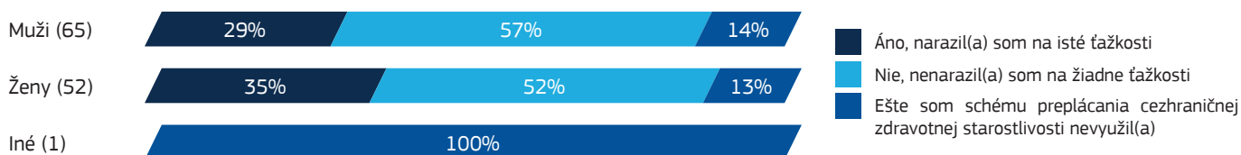
Obrázok č. 4 – skúsenosti a problémy pri použití schémy preplácania cezhraničnej zdravotnej starostlivosti

Poznámka: Počet názorov: 240